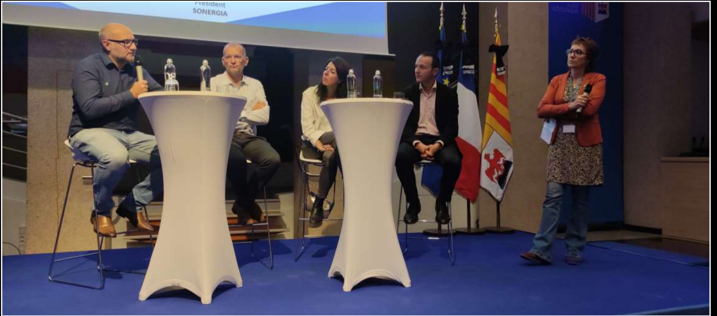
La table ronde