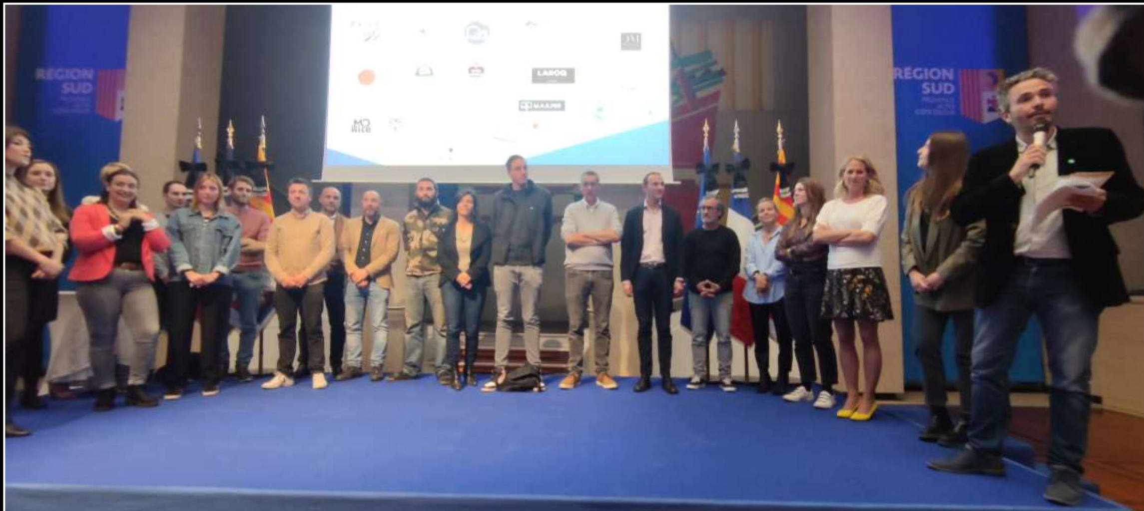
Les lauréats de la cohorte 2022